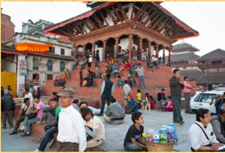
На фотографии: На ступенях храма.

обнажённые мужчины, потрясая свежесрезанными головами святых животных. Девочка не должна кричать от страха, потому что в эту ночь в неё должны войти духи двух богинь: богини Кали (очень жестокая и коварная богиня) и Дурги. После этого акта посвящения Кумари не может наступать на землю, и потому её всегда носят, если она появляется на улице, что случается всего-навсего шесть раз в году. И именно в этот момент мы и попали на её выход, когда сотни людей ожидали её появления, веря, что она может разрешить их проблемы.