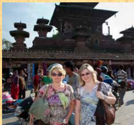
На фотографии: На

Нам было очень любопытно, и мы двинулись за всей толпой. Войдя во дворик храма, я почувствовала страшную атмосферу тьмы. Масса людей заполнила дворик в трепетном ожидании. Как нам объяснили - здесь, в этом храме, живёт живая богиня Кумари, которая сейчас выйдет, и ей можно будет принести свои нужды... На балкон вышел дряхлый «священник» и предупредил всех выключить камеры и фотоаппараты. Стояла напряжённая тишина, и вот, в окошке появилась девочка примерно лет 6-8. Всё, что я могла видеть, это печальные до боли глаза, устремлённые на толпу. У меня невольно потекли слёзы, я не могла больше там стоять и протискиваясь сквозь толпы людей, поспешила на улицу. В моём сердце было масса вопросов: Кто она такая? Почему все называют её живая богиня?