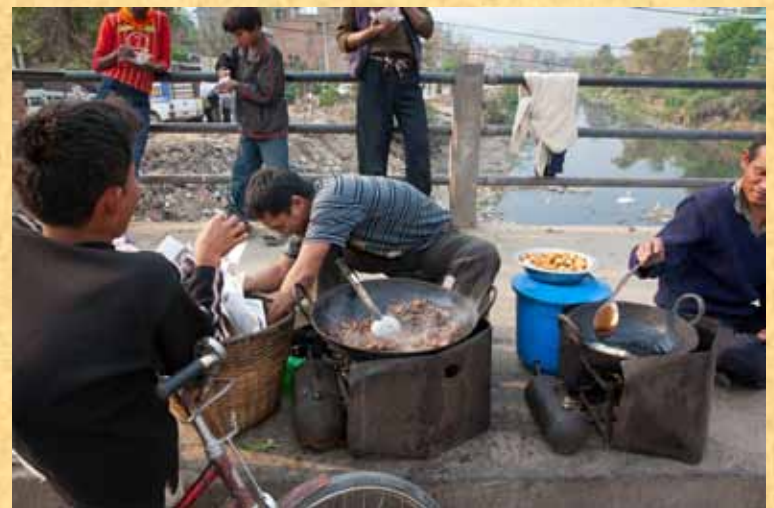
На фотографии: Одно из многочисленных «кафе» Катманду.

Ты и я - мы можем быть теми, кто встанет в проломе за страну Непал в своих молитвах, кто поддержит труд служителей своими финансами. Чтобы больше открывалось приютов для девочек, нужны финансы, и если ты хочешь помочь этим обездоленным, то стань участником программы «Дом Надежды».