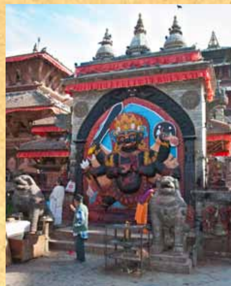
На фотографии: Один из многочисленных богов Непала.

улицы Катманду, я вначале растерялась. На одном перекрёстке пыльных дорог встретились древность и цивилизация. Несколько минут ушло на то, чтобы адаптироваться к узким улицам шумного города. Высоко в небо устремлялись здания, построенные более тысячи лет назад. Дело в том, что Катманду уже перевалило за 1,600 лет. Узкие до невозможности улицы были настолько переполнены: торговцами сладостями, одеждой, всевозможной утварью, божками, благовоениями и при этом ещё - тысячи спящих туда и сюда людей, что-то покупающих, поклоняющихся и просто стоящих в застывших позах. Весь этот колорит дополняли рикши и редкие мотоциклисты. Протискиваясь сквозь толпу, более всего нам хотелось запечатлеть жизнь кипящего города, но при этом избежать чтобы кто-то «освятит» нас своими благовоениями, которые воскуряются в городе непрерывно. Движущаяся живая масса вывела нас на площадь, которая как оказалось впоследствии была храмовая, где нам сразу бросилось в глаза что здесь не было суеты и торговли. Люди сидели и ходили тихо, чинно: многие просто медитировали, устремляя руки и взор к небу. Не успели мы ступить на храмовую территорию, как к нам проворно подскочили гуру и всевозможные «святые», пытаясь освятить нас своими благовоениями, но увидев нашу реакцию (я начала громко молиться), они обошли нас стороной. Идя по площади мне было очень больно