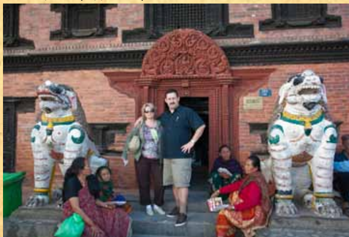
На фотографии: У входа в храм Кумари