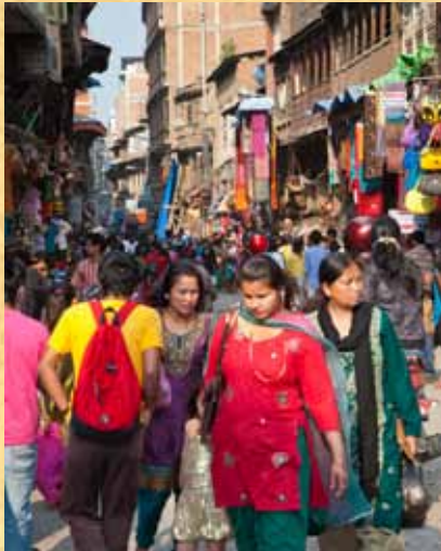
На фотографии: Центр Катманду.

Кумари одевают в красные одежды. Её волосы всегда очень туго стянуты на затылке (после того, как девочка становится нечистой, к примеру, после начала месячных, её выбрасывают, как ненужный материал на улицу, и тогда многие из них быстро лысеют), глаза и лицо накрашены в определённом стиле. В общем, зрелище не из приятных.